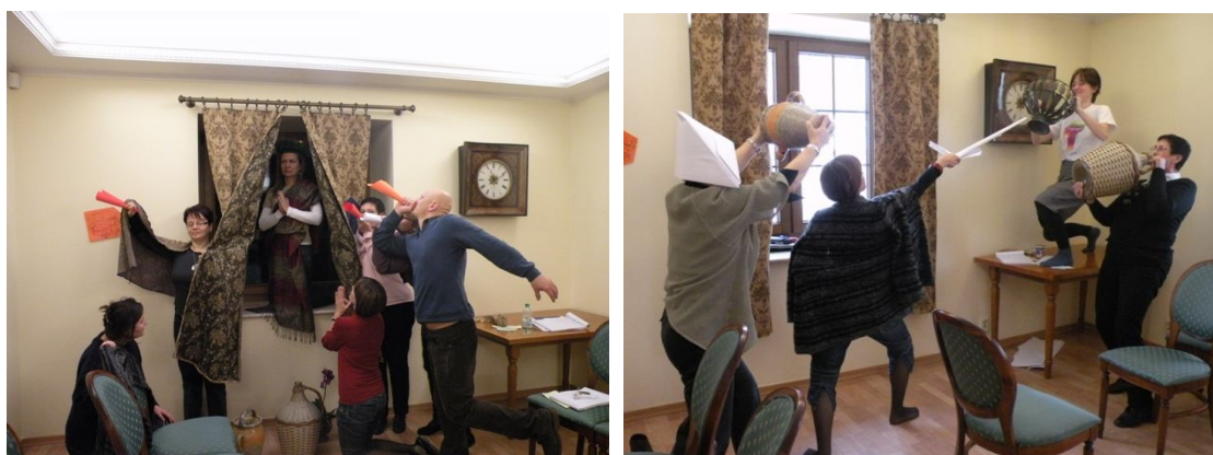
(zdjęcia z treningu kreatywności)

Wśród działań prowadzonych w ramach projektu są również superwizje oraz coaching, które mają charakter indywidualny.