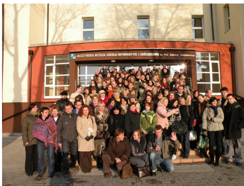
Olsztyn 13.03.2009; uczestnicy szkoleń, trenerzy i superwizorzy podczas pamiątkowego zdjęcia

Patronem medialnym VIII edycji Szkoły Trenerów STOP był portal ngo.pl